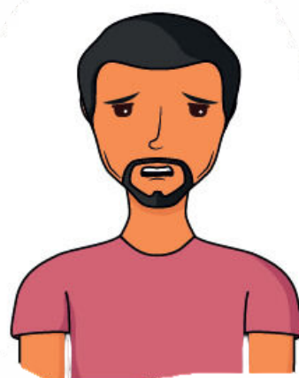
Perte de poids

Des doutes? Des questions? Contactez un professionnel de santé.