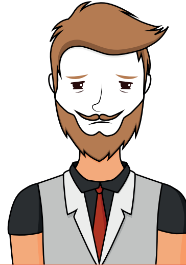
Fatigue / pâleur