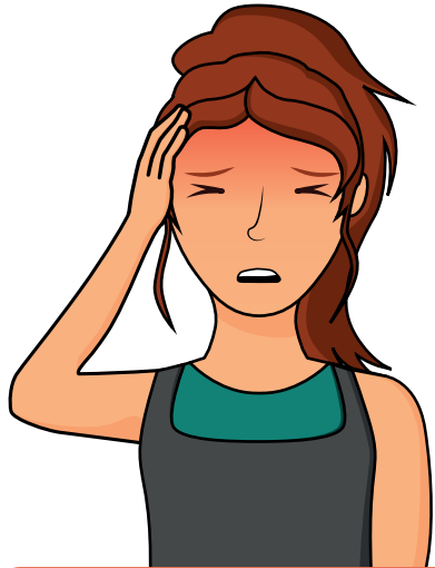
Mal de tête