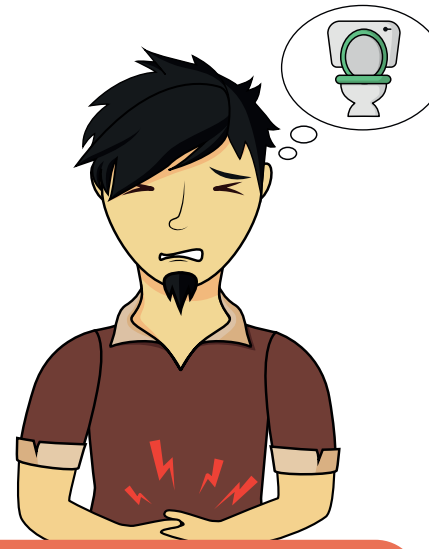
Douleurs abdominales Urines abondantes