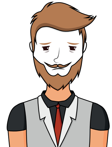
Fatigue / pâleur